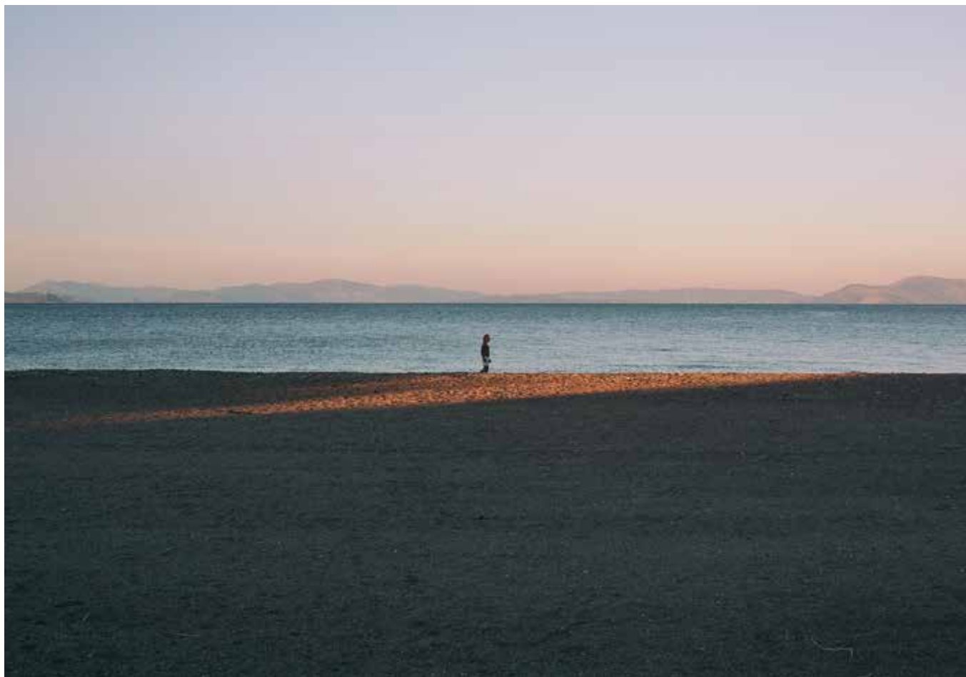
«Solitude», 2020. Μοναχική φιγούρα στην άδεια παραλία της Ραφήνας.

Η έμπνευση έρχεται μέσα από τα πιο απλά πράγματα. Ένα ταπεινό λουλούδι που φύτρωσε χθες στην άκρη του δρόμου, τα παιχνίδια με το φως την ώρα του δειλινού, το κύμα που σπκώθηκε ξαφνικά στην ήρεμη θάλασσα. Στην περίπτωση της φωτογράφου Λένας Κωνσταντάκου, εκτός από στοιχείο έμπνευσης, η απλότητα των πραγμάτων λειτούργησε και ως μέσο προσαρμογής στη νέα συνθήκη που δημιουργήθηκε στη ζωή της, όταν πριν από περίπου μία δεκαετία αποφάσισε να μετεγκατασταθεί από το Λονδίνο στην Ελλάδα.