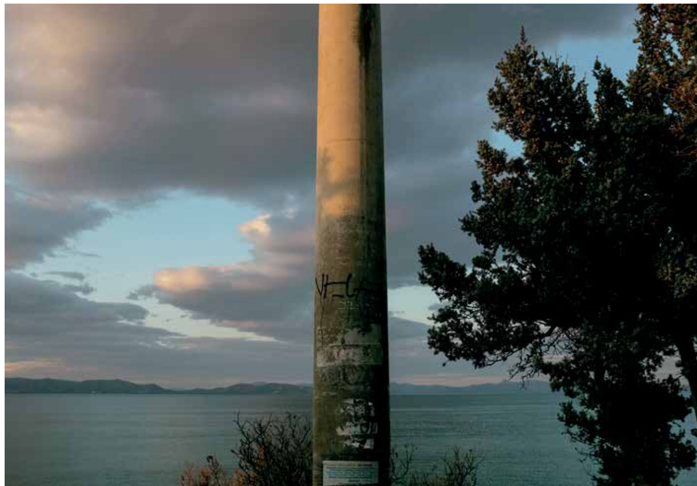
«Divine», 2020. Οδός θάλασσας, γεωμετρική σύνθεση με το βλέμμα στον ουρανό.

«Είναι μια παραμελημένη περιοχή, στην οποία δεν συμβαίνουν πολλά πράγματα. Κυλά αργά ο χρόνος, κι αυτό προσθέτει στην αυθεντικότητά της. Έχει την ομορφιά της απλότητας, που δεν έχουν π.χ. τα νότια προάστια της Αθήνας, παρόλο που βρέχονται από την ίδια θάλασσα. Σε εμένα προσέφερε την ποιότητα ζωής που αναζητούσα, είναι μια αθηναϊκή επαρχία κοντά στο κέντρο. Ακόμα και την αισθητική της, που κατά τόπους δεν είναι καλή, τη βρίσκω ενδιαφέρουσα, με διεγείρει φωτογραφικά. Το μόνο που δεν μου αρέσει, όσο κι αν ακούγεται κάπως αντιφατικό, είναι το καλοκαίρι, γιατί φέρνει μαζί του μια άναρχη πολυκοσμία. Ό,τι βλέπεις γύρω σου μεταμορφώνεται, ευτυχώς προσωρινά».