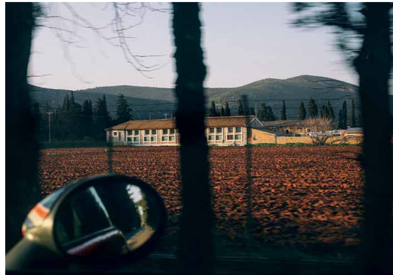
«Escaping», 2020. Οδηγώντας προς Σχινιά, στον δρόμο με τα κυπαρίσσια. Είναι μια διαδρομή που η φωτογράφος αγαπά για το ιδιαίτερο τοπίο της.

καθώς συναντιόμαστε για να μου συστήσει διά ζώσης ένα προς ένα τα μέρη όπου εκτυλίσσονται οι φωτογραφικές ιστορίες της. Ραφήνα, Λούτσα, Νέα Μάκρη, Σχινιάς. Ξεκινάμε από την οδό Θάλειας, στην άκρη της Ραφήνας, και μερικά μέτρα πιο κάτω σταματάμε μπροστά σε μια παράξενη άρκευθο – την ίδια που δεσπόζει στο ατμοσφαιρικό κάδρο το οποίο ονόμασε «Magic tree» και δημοσιεύθηκε στα τέλη Νοεμβρίου στη βρετανική Guardian. «Αυτό το δέντρο, έτσι όπως ανοίγουν τα κλαδιά του κομψά σαν βεντάλιες και ακουμπούν στη γη, μου φέρνει στο μυαλό φόρεμα του 19ου αιώνα. Όταν το είδα, το πρώτο πράγμα που σκέφτηκα είναι πως τελικά η μαγεία βρίσκεται παντού», λέει. Συνεχίζουμε για λίγο ακόμη με κατεύθυνση την παραλία